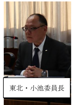
東北・小池委員長