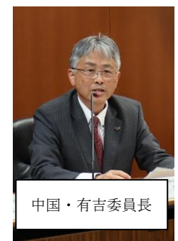
中国・有吉委員長