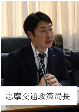
志摩交通政策局長

かということが非常に大きな課題になっている。大分でバスの軽油がなくなった際、国土交通省から運輸局の方に話をさせていただき、解決したということがあった。お礼申し上げます。公共交通を優先的に考えていただくなど、限られた資源を少しでも長く使えるような取り組みを、ぜひ国土