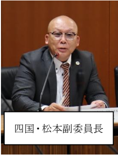
四国・松本副委員長

まの声を聞きながら、よりよいものをめざしていきたい」「災害が頻発で激甚化しており、災害復旧制度自身も進化をしているが、災害の対応については常に勉強したいと思っている。また情報をいただきたい」などと回答があった。